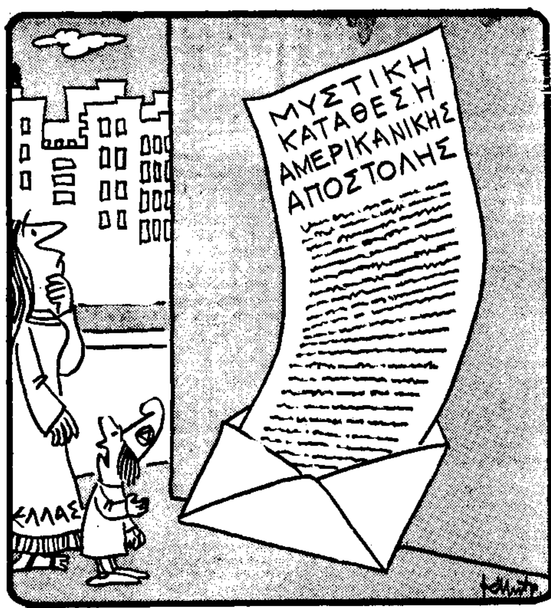
Μαμά, αυτοί είναι οι «φάκελοι θανάτου» που λένε;